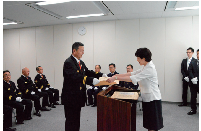
高市総務大臣から受賞団体へ感謝状を贈呈