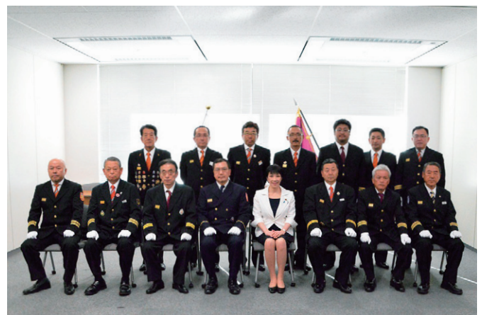
総務大臣感謝状受賞団体