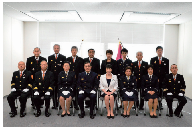
総務大臣感謝状受賞団体